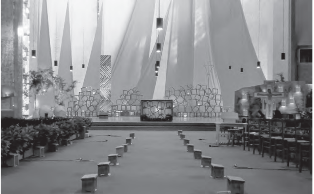
Innenraum der Kirche in Taizé