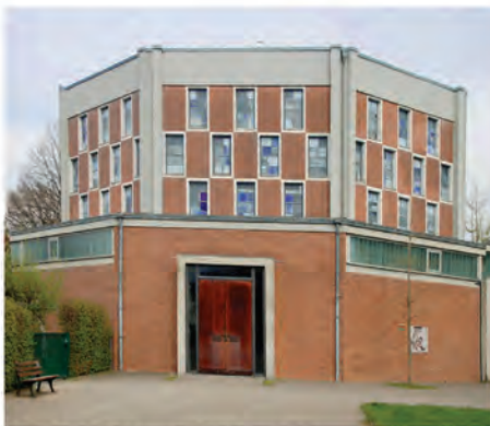
St. Michael - Odenkirchen