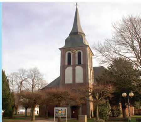
Ev. Kirche Odenkirchen